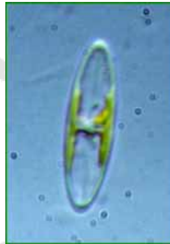
Fig.1. Nitzschia obtuse var. scalpelliformis Grunow, Reference: Huang 1982, p.312, pl.7, fig.4-6.