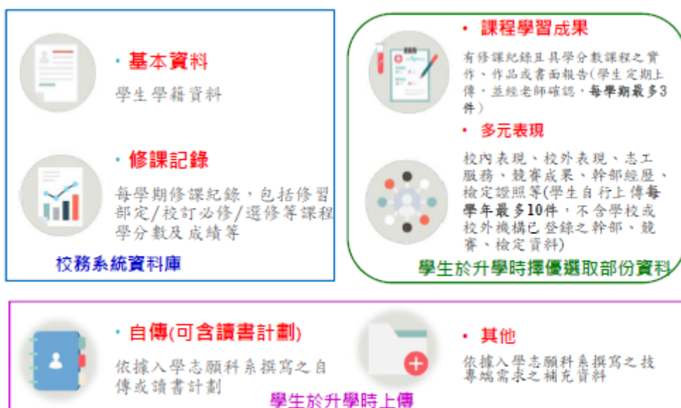
圖一、學習歷程檔案資料內容