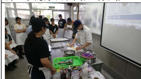
圖四. 業師協同教學