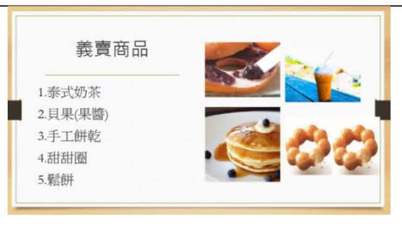
圖十一. 義賣企劃商品範例