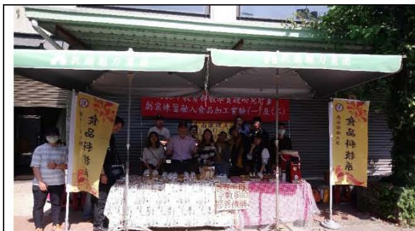
圖六. 台南孔廟商圈義賣創業練習活動