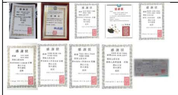
圖十四. 各組網路義賣創業練習所得，樂捐慈善機構之感謝狀