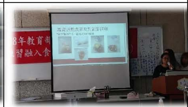
圖十七. 網路義賣成果發表競賽實況