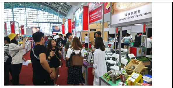
圖三. 同學參觀高雄國際食品展