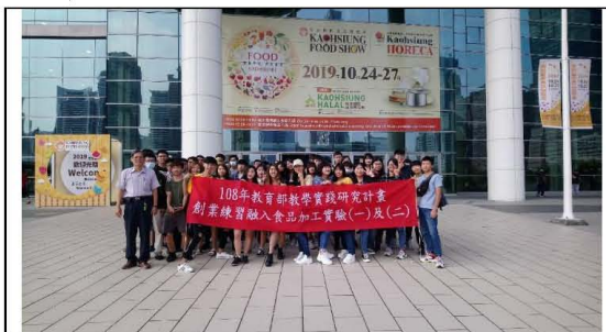
圖二. 參觀高雄國際食品展合影