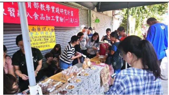
圖七. 觀摩同學拍照紀錄義賣實況