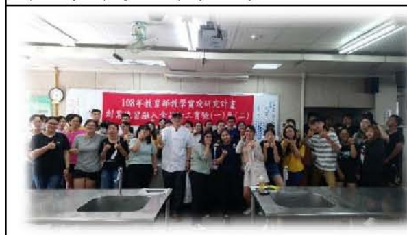
圖十六. 網路義賣成果發表競賽合影