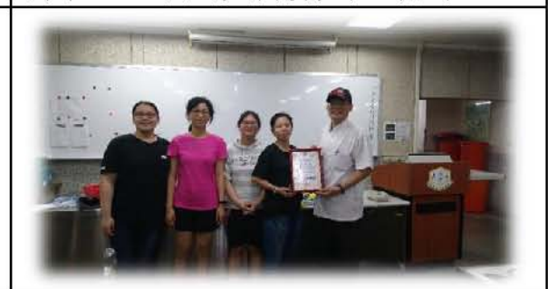
圖十五. 頒發各組樂捐感謝狀