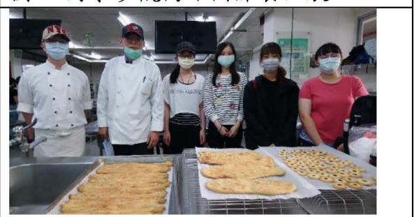
圖五. 業師、教師及產品合影