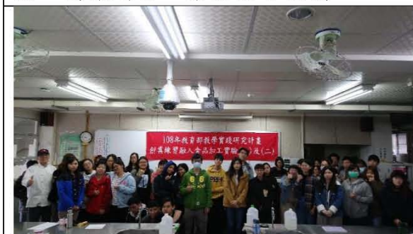
圖十. 義賣企劃發表競賽