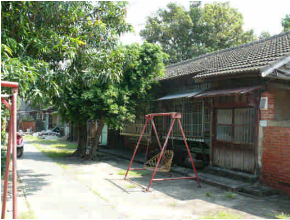
相 21 原專賣局臺南支局安平分室官舍