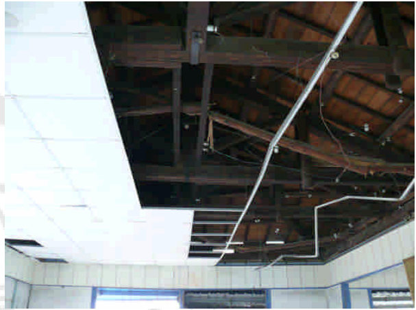
相 24 原專賣局屏東煙草試驗場(九塊)