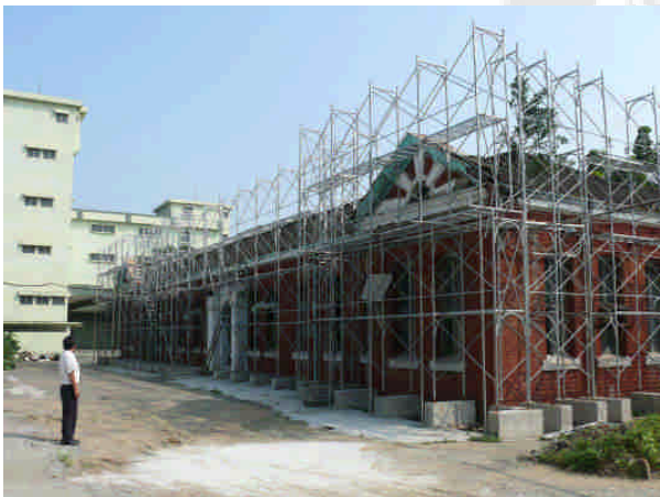
相 5 原專賣局台南出張所