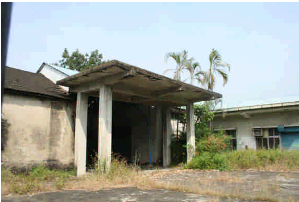
相 15 原專賣局嘉義支局頂六煙草耕作指 導所、專賣局嘉義支局頂六葉煙草收納所