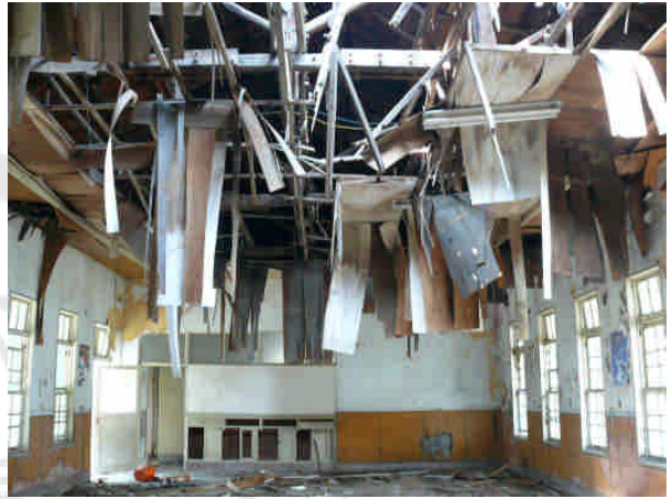
相 30 原專賣局屏東支局廳舍