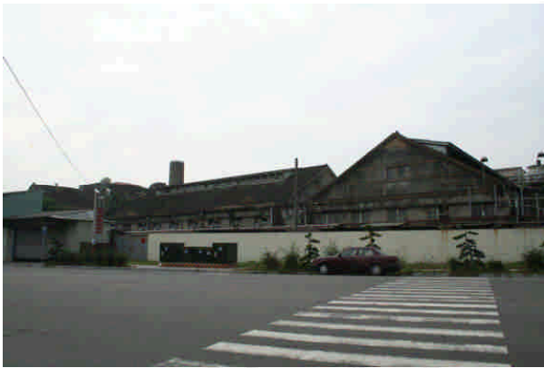
相 4 原專賣局嘉義酒工場