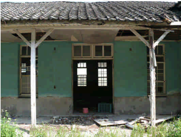
相 28 原專賣局屏東支局廳舍