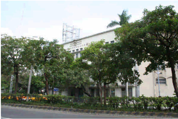
相 3 原專賣局嘉義支局倉庫