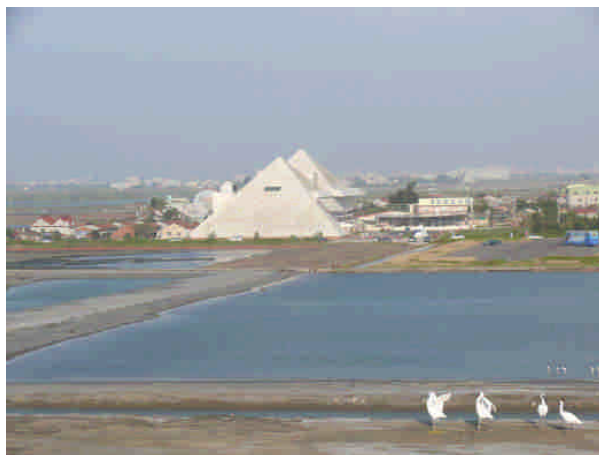
相 11 原專賣局北門出張所七股鹽田