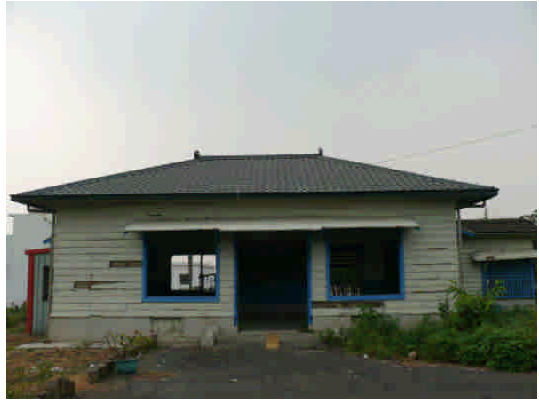
相 23 原專賣局屏東煙草試驗場(九塊)