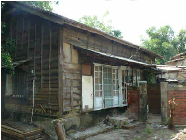
相 22 原專賣局臺南支局安平分室官舍