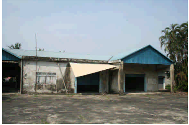
相 17 原專賣局嘉義支局鹿麻產煙草耕作 指導所、專賣局嘉義支局鹿麻產葉煙草收納 所