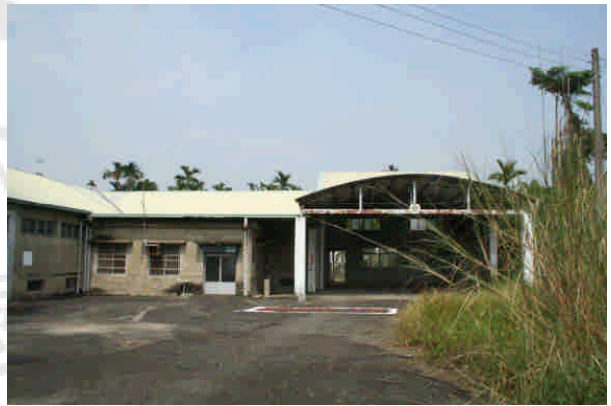
相 18 原專賣局嘉義支局十字路巡視所