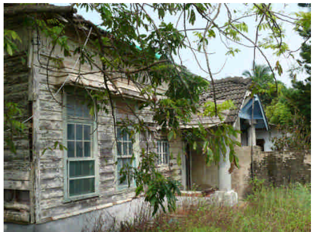
相 8 原專賣局台南支局安平分室