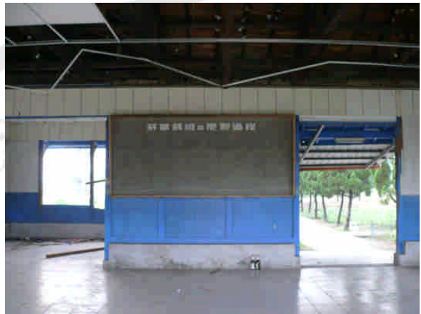
相 25 原專賣局屏東煙草試驗場(九塊)