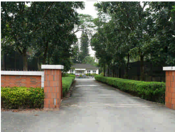
相 10 原專賣局屏東支局煙草耕作指導所(長興)