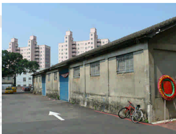
相 12 原專賣局臺南支局三分子倉庫