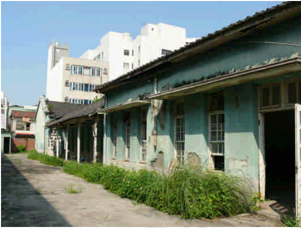
相 27 原專賣局屏東支局廳舍