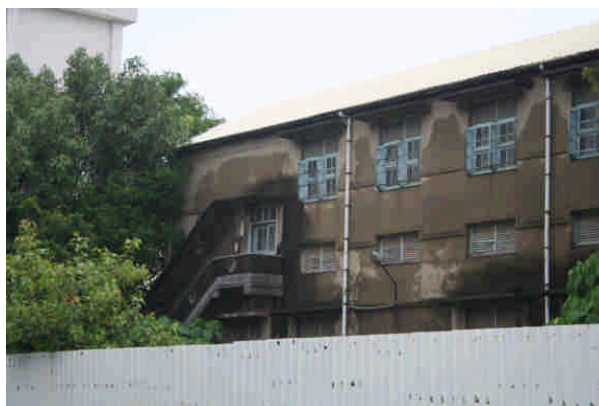
相 13 原專賣局嘉義支局葉煙草再乾燥場(北社尾)