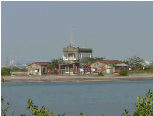
相 9 原烏樹林出張所