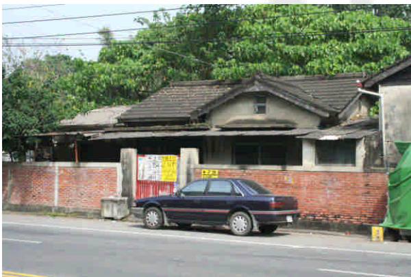
相 16 原專賣局嘉義支局頂六煙草耕作指 導所、專賣局嘉義支局頂六葉煙草收納所