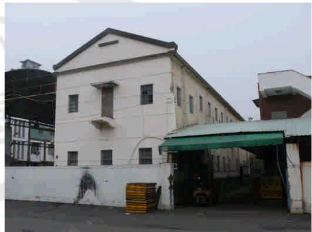
相1 原專賣局高雄支局倉庫

1. 專賣局高雄支局倉庫（堀江町四丁目） 專賣局高雄支局其仍保有日治時期興建之倉庫。