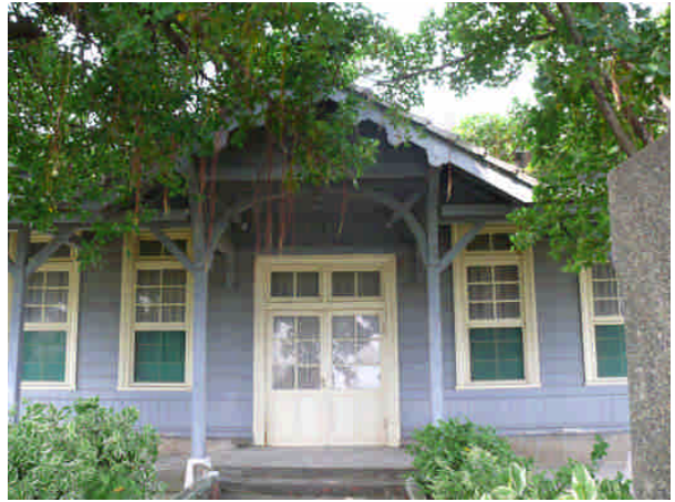
相 6 原專賣局安平出張所