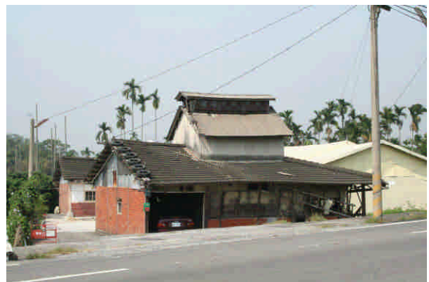
相 31 嘉義鄉間的現存菸樓

例如嘉義仍保有菸場以及至少三處菸葉收納所，加上民間的菸樓，適足以形成體系完整的菸葉文化景觀。其所具有的良好條件，剛好彌補台北松山菸場以及美濃菸樓在菸業體系落差過大的空白，建構由下而上完整的菸業體系產業文化。