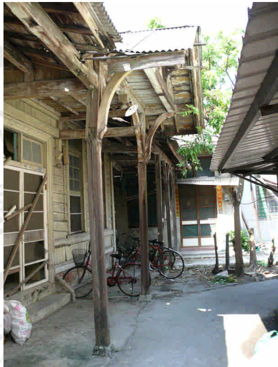
相 7 原專賣局台南支局