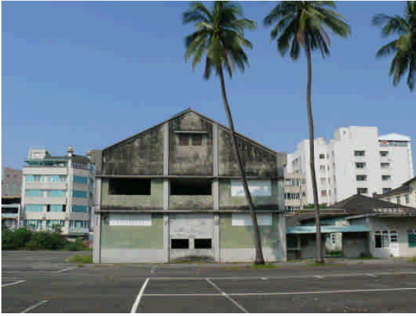
相 26 原專賣局屏東支局倉庫