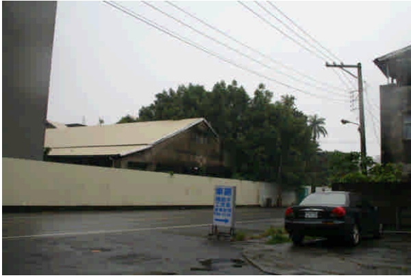
相 14 原專賣局嘉義支局葉煙草再乾燥場 (北社尾)