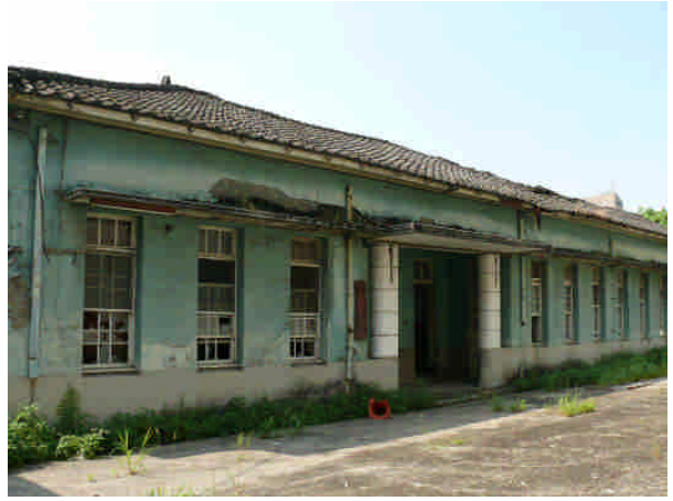
相 29 原專賣局屏東支局廳舍