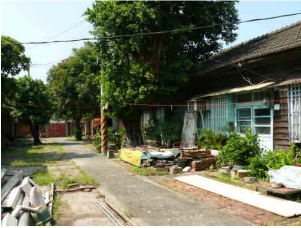
相 20 原專賣局臺南支局安平分室官舍